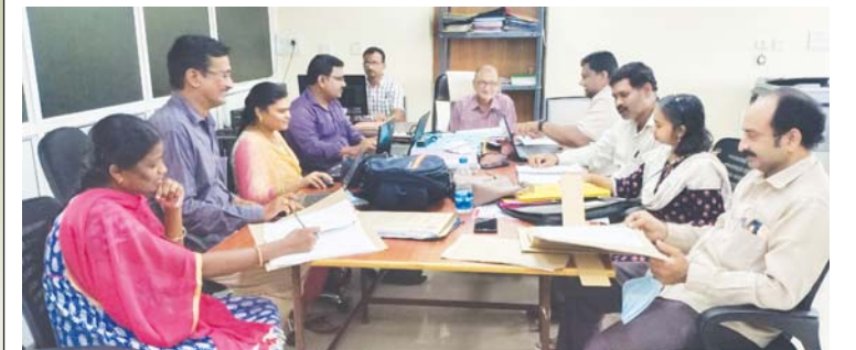
నాక్ అక్రిడిటేషన్ యొక్క ప్రయోజనాలు

ఏ దేశమైనా అభివృద్ధి చెందడంలో విద్య కీలక పాత్ర పోషిస్తుంది. అందువల్ల ఉన్నత విద్య యొక్క పరిమాణం (పెరిగిన యాక్సెస్) మరియు నాణ్యత (అందించే అకాడమిక్ ప్రోగ్రామ్ల ఔట్పుట్ మరియు శ్రేష్టత) ఎంతో ప్రధానమైనది. విశ్వవిద్యాలయాలు ఉన్నత ప్రమాణాలును పాటిస్తూ నాణ్యమైన విద్య, పరిశోధన, ప్రాజెక్టులు, విద్యార్థుల ప్రగతి, వసతులు, వసతులు మరియు పాలన, నిర్వహణ వంటి అన్ని అంశాలను అంచనా వేస్తూ విశ్వవిద్యాలయ ప్రమాణాల స్థాయి ఆధారంగా నేషనల్ అసెస్మెంట్ అండ్ అక్రిడిటేషన్ కౌన్సిల్ (NAAC) గుర్తింపునిస్తుంది. NAAC అక్రిడిటేషన్ విశ్వవిద్యాలయంలో ఫ్యాకల్టీ సభ్యులు, సిబ్బంది, తల్లిదండ్రులు, విద్యార్థులు, పూర్వ విద్యార్థులకు ప్రయోజనకరంగా ఉంటుంది.