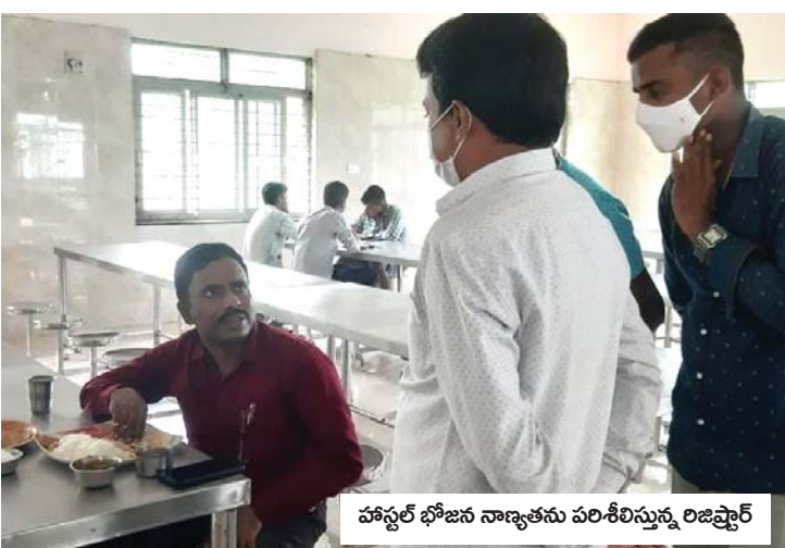
హాస్టల్ భోజన నాణ్యతను పరిశీలిస్తున్న రిజిస్ట్రార్