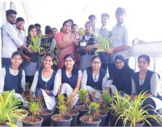
తెలిపారు. యూనివర్సిటీ కాలేజ్ ఆఫ్ ఇంజనీరింగ్ లోని సి.ఎస్.ఈ, ఐ.టి విద్యార్థులు, ఎన్.ఎస్.ఎస్. వాలంటీర్లు ఈ కార్యక్రమంలో పాల్గొన్నారు.